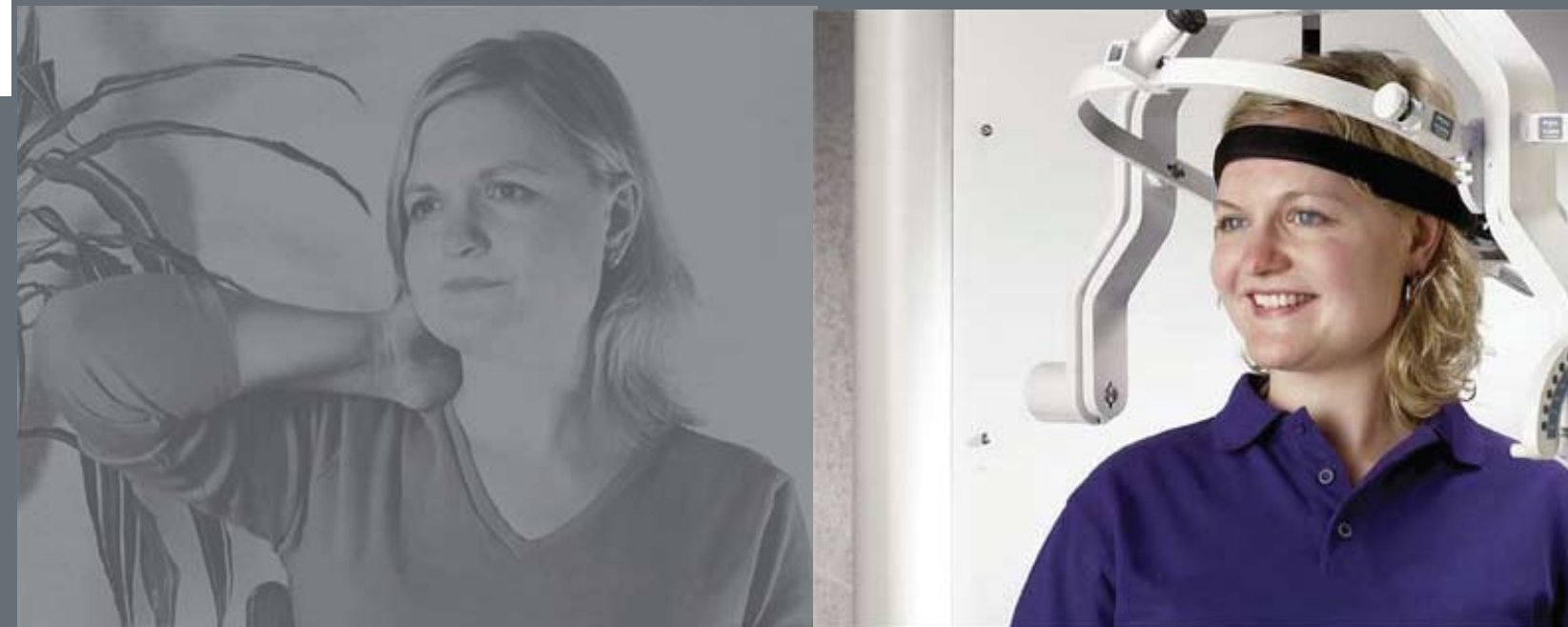
Unidad Multicervical - MCU™

Restaura tu columna vertebral ... y rehabilitate practicando.